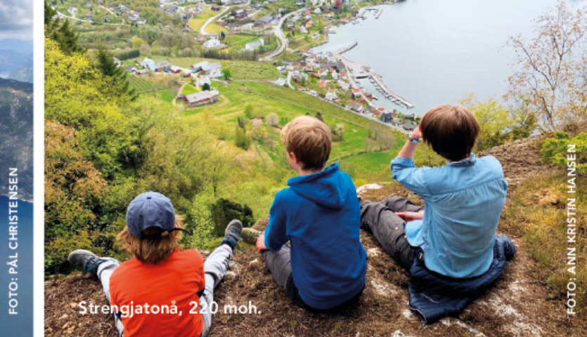
Strengjatonå, 220 moh.