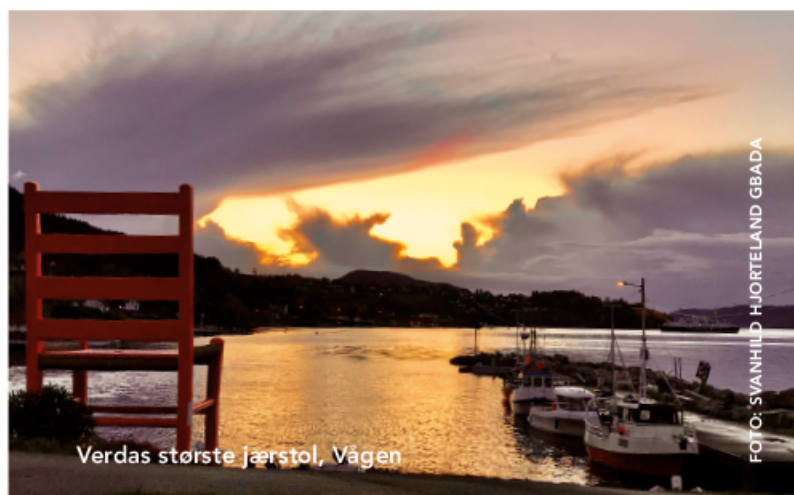
Verdas største jærstol, Vågen