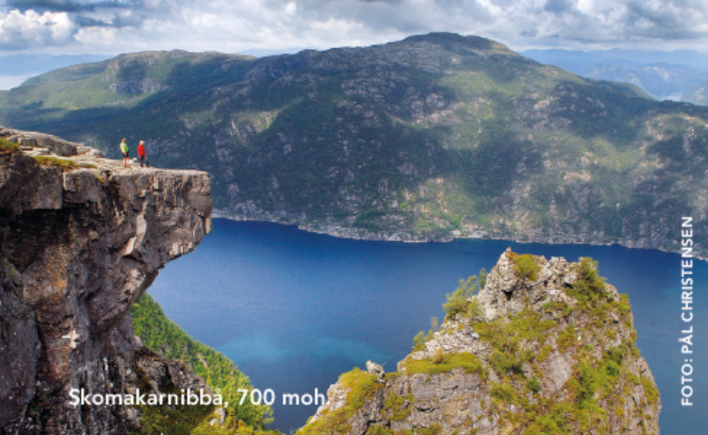
Skomakarnibbå, 700 moh.